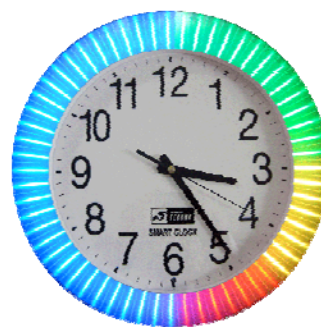
スマートクロック。長針のある側が電力使用状況、反対側がこの 30 分間の予測デマンド。

当社では、節電目標を前年比の 10%（約 43,000kwh）以上に設定。これは CO 2 排出量に換算すると約 16 t の削減になり、樹齢 50 年の杉 1150 本の年間吸収量に相当します。折しも実施される電力料金の値上げ対策としても有効であると考えております。